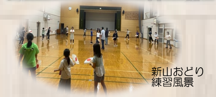
新山おどり 練習風景