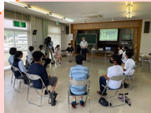
中学生と意見交換会