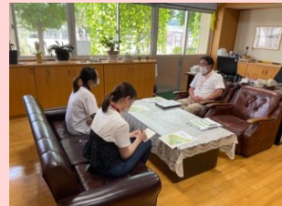
これからの小学校・地域社会との連携について(原校長先生と)