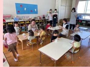
保育所見学・懇談