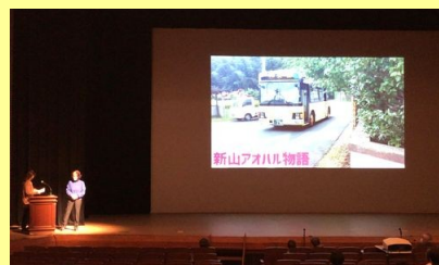
舞台発表は「新山アオハル物語」を上映しました。