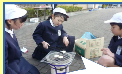
炭に火をつけるのは大変だったよ。